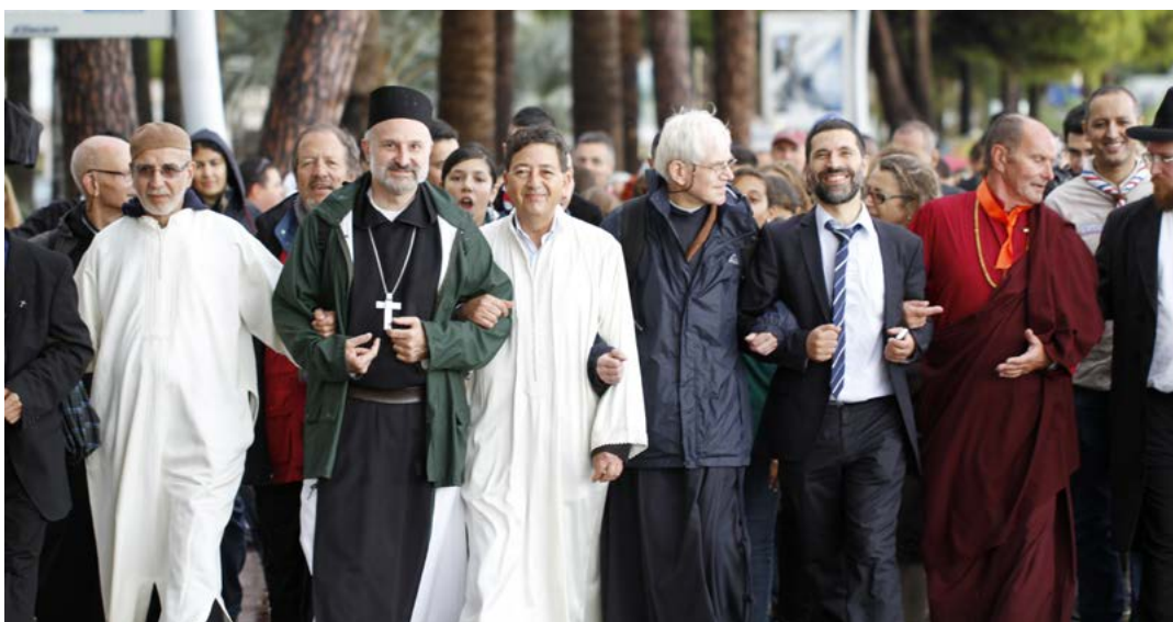
Troisième Festival du Vivre Ensemble. Construisent la fraternité et cheminent ensemble vers la paix. Cannes, 2013.