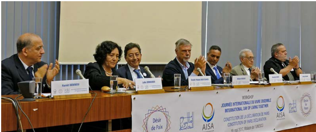
Workshop Journée International du Vivre Ensemble, 19 mai 2017, Maison de l'UNESCO, Paris

La JIVEP constitue un engagement fort au sein de la famille humaine, conjuguant les notions de citoyenneté, de pluralisme, d'humanisme et de spiritualité. Elle propose une dynamique de Paix et lance son message aux citoyens du monde afin de construire une société fondé sur le respect du vivant : Vivre Ensemble, c'est Faire Ensemble. Cette journée présentée par l'Algérie a été adoptée par consensus le 8 décembre 2017 à l'ONU et sera désormais fêtée le 16 Mai dans 172 pays dans le monde.