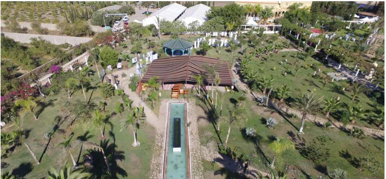
Centre de la Fondation Djanatu al-Arif, Mostaganem (Algérie)