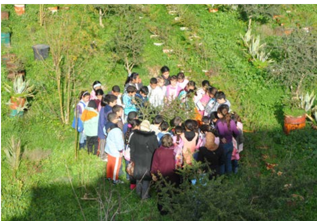
Des enfants autour d'un arganier, Centre de la Fondation Djanatu al-Arif