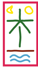
Djanatu al Arif