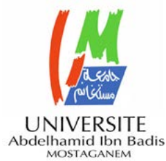
UNIVERSITE Abdelhamid Ibn Badis MOSTAGANEM