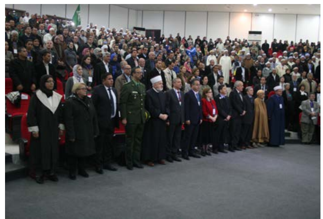
Ouverture solennelle du festival de la Journée Internationale du Vivre Ensemble, à l'Université Abdelhamid Ibn Badis. Organisé par La fondation Djanatu al-Arif en 2015